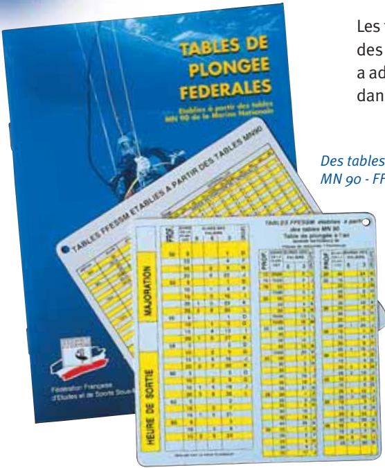
Des tables MN 90 - FFESSM.

Un palier est un arrêt en fin de plongée à une certaine profondeur (3 mètres par exemple) pendant un temps donné. Il sert à éliminer l'azote en excès dans notre corps, lorsque nous en avons emmagasiné une telle quantité qu'une remontée lente ne suffit plus.