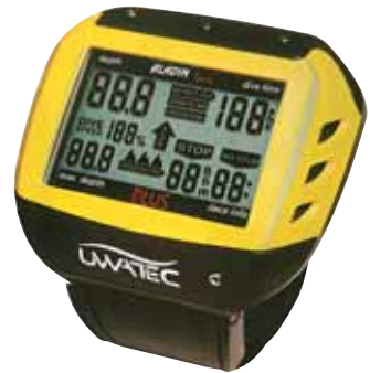
Un ordinateur de plongée.

La courbe des plongées sans palier, appelée aussi « courbe de sécurité » indique le temps maximum sans palier à une certaine profondeur, pour une plongée unique dans la journée.