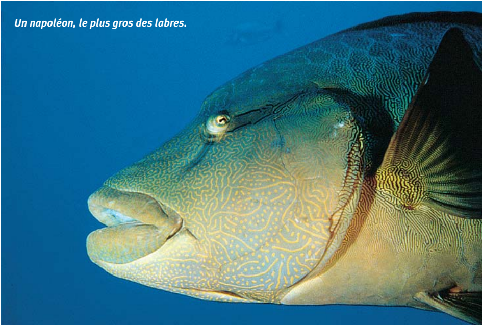
Un napoléon, le plus gros des labres.

se bloque par un véritable cran d'arrêt, similaire au système de blocage d'une flèche sur cette arme. Certains balistes vivent dans les mers tempérées (Atlantique, Méditerranée).