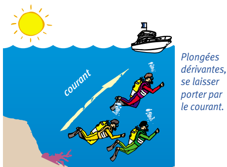
Plongées dérivantes, se laisser porter par le courant.

Si vous êtes confronté à un courant marin « classique » (Méditerranée, Caraïbes...), débutez toujours votre plongée à contre-courant . De plus, soyez prêt à palmer dès la mise à l'eau , videz votre gilet, pour offrir moins de prise au courant et éviter de vous laisser emporter. Immergez-vous le plus tôt possible : le courant n'est parfois présent qu'en surface, il disparaît alors dans la zone des 3 à 5 mètres. Par contre, s'il s'agit d'un courant de marée, il faut prendre en compte d'autres paramètres. Généralement, la mise à l'eau a lieu un peu avant l'étalement. Dans ce cas, en fin de plongée, le courant sera inversé. Il vous faut donc commencer votre plongée dans le sens du courant, pour revenir aussi avec le courant lorsque la renverse 23 aura eu lieu.