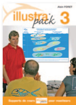
SCHEMAS Faites vos cours en utilisant les schémas Plongée Plaisir