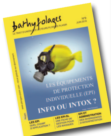
REVUE NUMERIQUE Le trait d'union entre moniteurs et lecteurs Plongée Plaisir Gratuite, sur inscription Plongée Plaisir (membre) www.plongee-plaisir.com