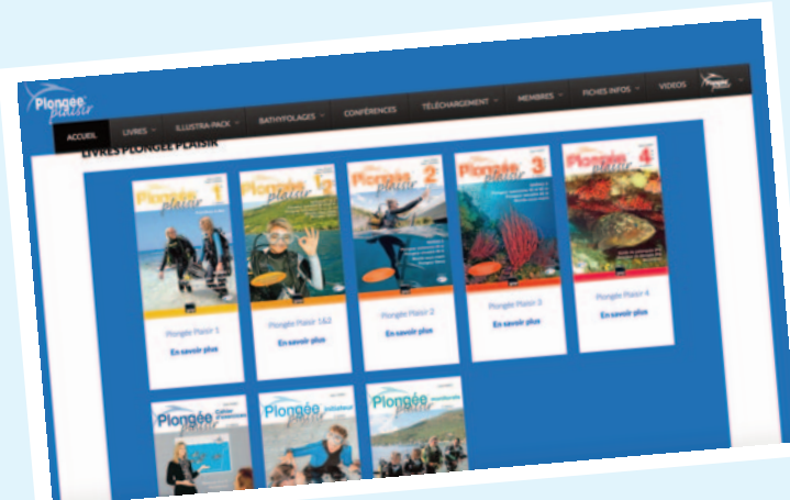
SITE WEB www.plongee-plaisir.com Présentation des livres et supports pédagogiques Actualité de la plongée Fiches Infos Espace téléchargement (ressources)