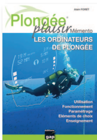
MEMENTO ORDINATEURS DE PLONGÉE