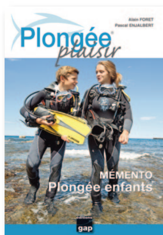
MEMENTO PLONGÉE ENFANTS