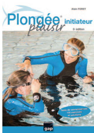
LIVRE INITIATEUR Pédagogie, réglementation