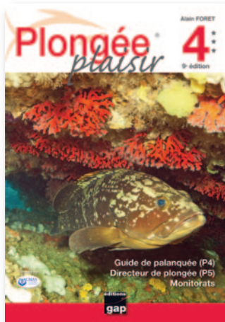
LIVRE Connaissances (pour la pédagogie de la théorie ou les épreuves écrites des monitorats d'Etat).