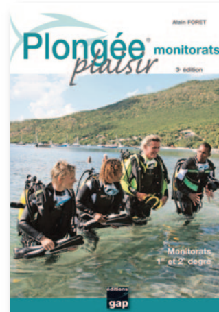
LIVRE MONITORATS Pédagogie, réglementation